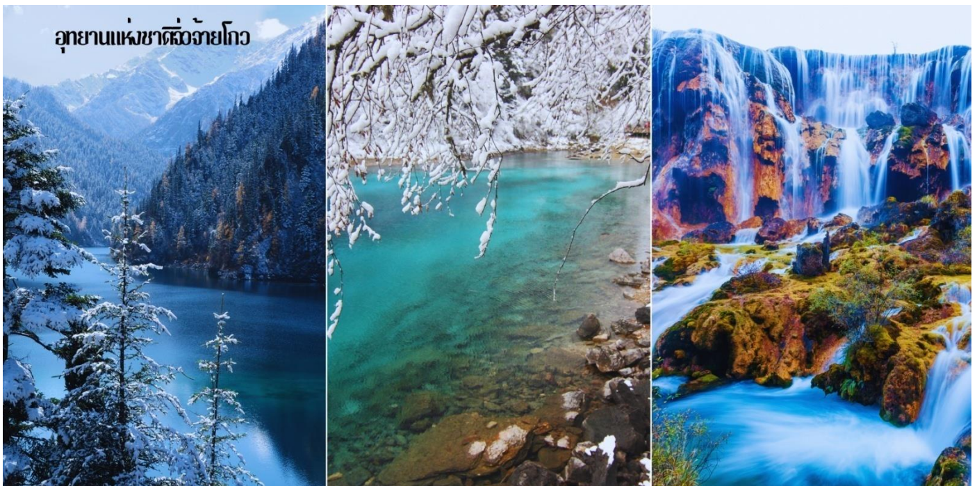
อุทยานแห่งชาติจิวจ้ายโกว

๑๐ บริการอาหารกลางวัน ณ ภัตตาคาร (ห้องอาหารภายในอุทยาน)