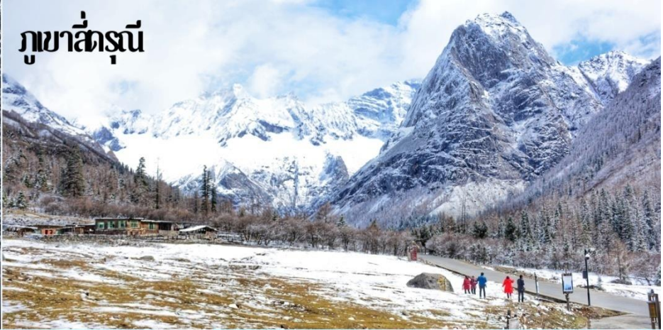
ภูเขาสี่ดรุณี