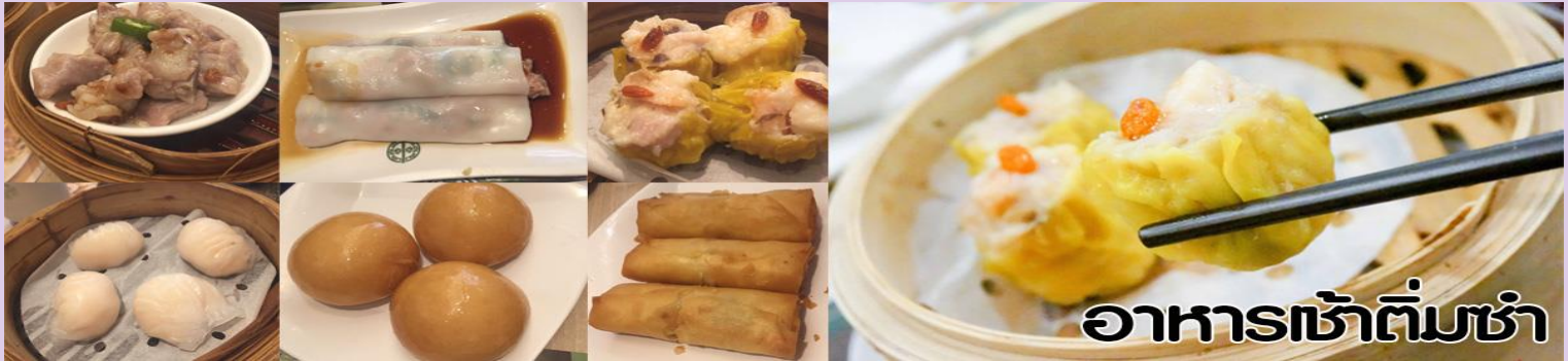
อาหารเช้าติ่มซำ

นำท่านไปไหว้ เจ้าแม่กวนอิมสงฮำ (Kun Im Temple Hung Hom) เป็นวัดเจ้าแม่กวนอิมที่มีชื่อเสียงแห่งหนึ่งในฮ่องกง ขอพรเจ้าแม่กวนอิมพระโพธิสัตว์แห่งความเมตตา ช่วยคุ้มครองและปกป้องรักษาวัดเจ้าแม่กวนอิมที่ Hung Hom หรือ “Hung Hom Kwun Yum Temple” เป็นวัดเก่าแก่ของฮ่องกงสร้างตั้งแต่ปี ค.ศ. 1873 ถึงแม้จะเป็นวัดขนาดเล็กที่ไม่ได้สวยงามมากมาย แต่เป็นวัดเจ้าแม่กวนอิมที่ชาวฮ่องกงนับถือมาก แทบทุกวันจะมีคนมาบูชาขอพรกันแน่นวัด ถ้าใครที่ชอบเสียงเซียมซีเขาบอกว่าที่นี่แม่นมากที่พิเศษกว่านั้น นอกจากสักการะขอพรแล้วยังมีพิธีขอของอั้งเปาจากเจ้าแม่กวนอิมอีกด้วย ซึ่งคนส่วนใหญ่จะนิยมไปในเทศกาลตรุษจีนเพราะเป็นสิริมงคลในเทศกาลปีใหม่ ซึ่งทางวัดจะจำหน่ายอุปกรณ์สำหรับเช่นไหว้พร้อมซองแดงไว้ให้ผู้มาขอพร เมื่อสักการะขอพรโชดลากแล้วก็นำซองแดงมาวนเหนือกระถางรูปหน้าองค์เจ้าแม่กวนอิมตามเข็มนาฬิกา 3 รอบ และเก็บซองแดงนั้นไว้ซึ่งภายในซองจะมีจำนวนเงินที่ทางวัดจะเขียนไว้มากน้อยแล้วแต่โชด ถ้าหากเราประสบความสำเร็จเมื่อมีโอกาสไปฮ่องกงอีกก็ค่อยกลับไปทำบุญ ช่วงเทศกาลตรุษจีนจะมีชาวฮ่องกงและนักท่องเที่ยวไปสักการะขอพรกันมากขนาด