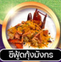
ซีฟู้ดกุ้งมังกร