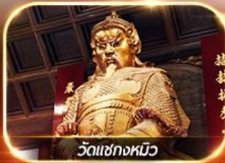
วัดเซกทงหมิว