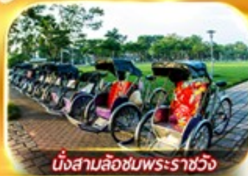
นั่งสามล้อชมพระราชวัง

สัมผัสความสวยงามหมู่บ้านสไตลฝรั่งเศสที่บานาฮิลล์ วัดเทียนมู่ พระราชวังเว้ สัมผัสเมืองโบราณฮอยอัน ล่องเรือกระดิง