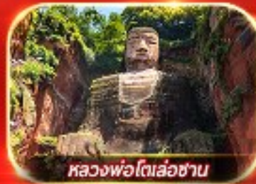
หลวงพ่อดโตเล่อซาน