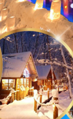
หมู่บ้านเทพนิยาย นิงเกิลทอเรส