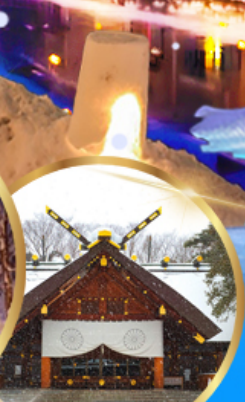
ศาลเจ้า ออกโทโต

เดินทาง 04 - 09 กุมภาพันธ์ 68 05 - 10 กุมภาพันธ์ 68 06 - 11 กุมภาพันธ์ 68