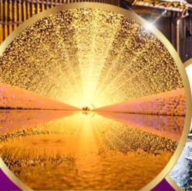
นาบาระ โนะ ซาโตะ