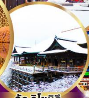
วัด คิโยมิตสึ