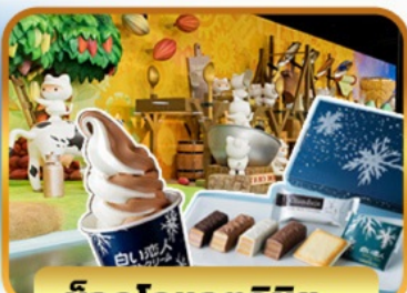
ช็อกโกแลตชิชียะ