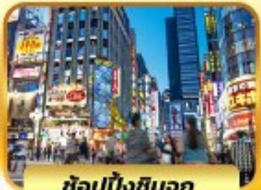
ช้อปปิ้งชินจูกุ