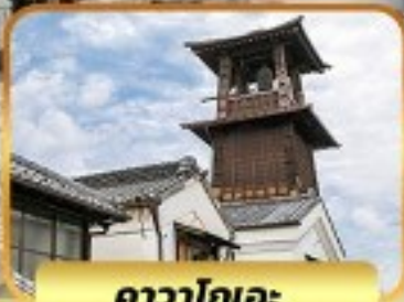
คาวาโกเอะ