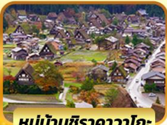
หมู่บ้านชิราคาวาโกะ