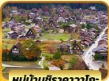
หมู่บ้านชิราคาวาโกะ