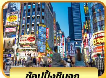
ช้อปปิ้งชินจูกุ