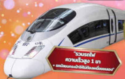
"รวมรถไฟ ความเร็วสูง 1 ไร่ + รถบริการกระเป๋าไม่มีต้องหิ้วเอง"