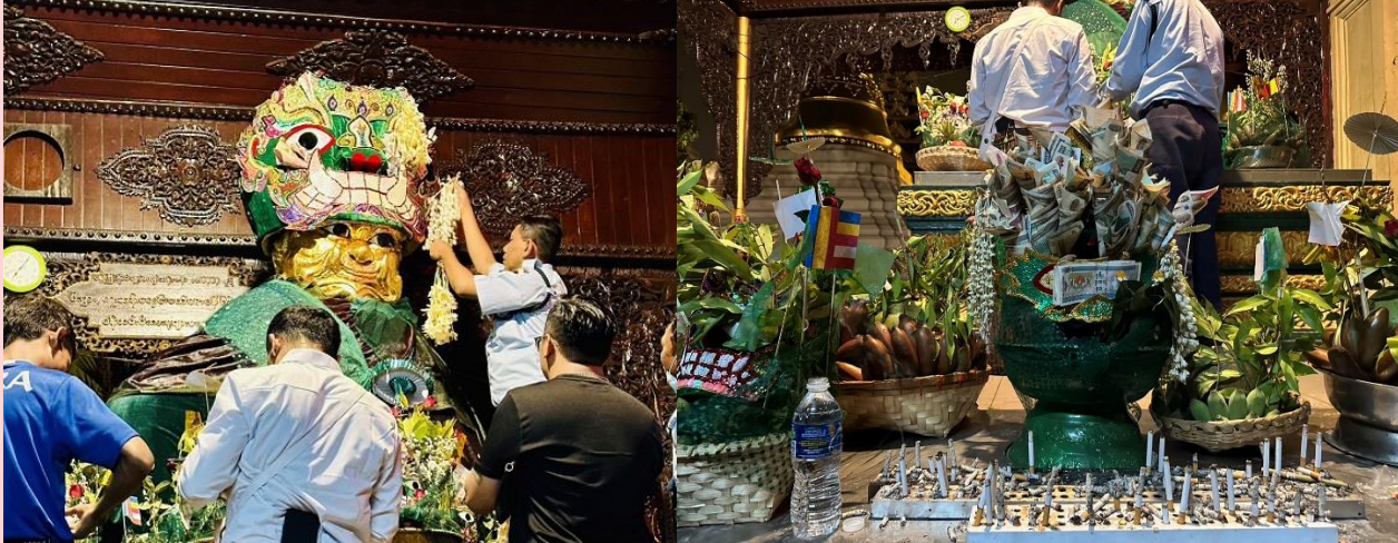
วิธีการขอพรจากแม่ยักษ์

พาท่านเดินไปขอพรที่ แม่ยักษ์ ผู้ปกป้องดูแลเจดีย์ คนพม่าเชื่อว่าแม่ยักษ์... จะช่วยในการตัดกรรมจากเจ้ากรรมนายเวร โดยเฉพาะอย่างยิ่งผู้ที่มีเวรกรรมกับเจ้ากรรมนายเวรทั้งหลายช่วยขจัดเคราะห์กรรม ขจัดอุปสรรค ติดขัดต่างๆ ความสำเร็จอธิษฐานขอให้ท่านช่วย ให้ชีวิตของคุณมีแต่ดีขึ้นเรื่อยๆ ซึ่งถ้าหากคุณกำลังมีทุกข์และหาหนทางไม่ออก ก็ลองมาไหว้ขอพรแม่ยักษ์ให้ช่วยบันดาลให้สิ่งร้ายๆ สิ่งไม่ดี ออกไปจากชีวิต และขอให้ชีวิตมีแต่สิ่งดีๆ เข้ามา นอกจากนี้ยังเชื่อกันว่าแม่ยักษ์... ยังช่วยเรื่องความมีชื่อเสียงโด่งดัง เป็นที่รู้จักก้าวหน้าในหน้าที่การงาน ใครที่ตกงานอยู่ จุดนี้เป็นอีกหนึ่งจุดที่ต้องห้ามพลาด ปล.แม่ยักษ์จะประดิษฐานอยู่ติดกับบันไดประตูทางทิศตะวันออกค่ะ