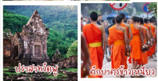
ปราสาทวัดพู