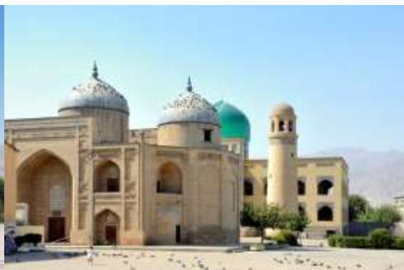
Sheikh Muslihiddin Mausoleum