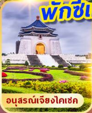
อนุสรณ์เจียงไคเชค