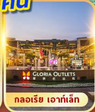
กลอเรีย เอาท์เล็ต