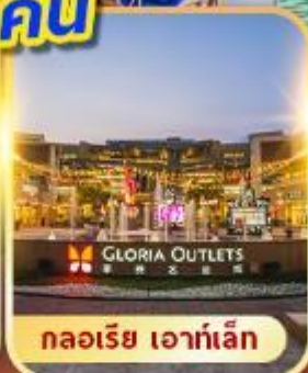
กลอเรีย เอาท์เล็ต