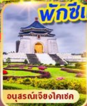
อนุสรณ์เจียงไคเชค

เที่ยวเต็ม!! ไข่มุกอันอิสระ พักซีเหมินติง 2 คืน