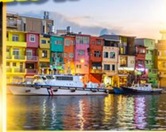
หมู่บ้านประมงเจินปิง