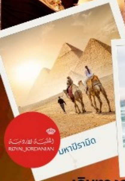
มหาปิรามิด