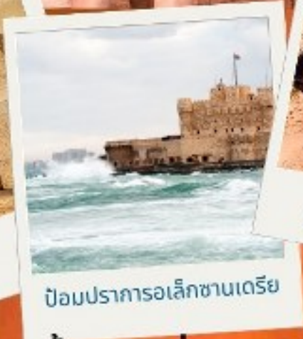
ป้อมปราการอเล็กซานเดรีย