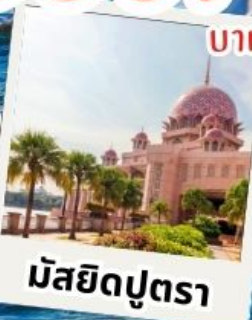
มัสยิดปุตรา