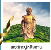
พระใหญ่หลิงซาน

วัดพระใหญ่หลิงซาน / ศาลาฟานกง / จตุรัสหยวนหลง / เมืองโบราณผานหลงกุจิ้น / Tian An 1,000 Trees Square / ตลาดดิ้งหวังเมี่ยว สวนสนุกเซียงไฮ้ดิสนีย์แลนด์เต็มวัน / ถ่ายรูปหอไข่มุก / ลอดอุโมงค์เลเซอร์ / ถนนนานกิง / หาดไว่ทาน / STARBUCKS RESERVE ROASTERY