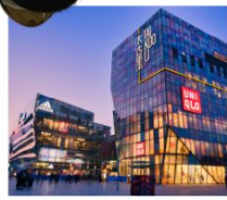
ย่านซานหลี่ตุ่น