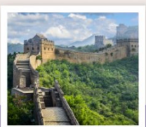
ท่าแพงเมืองจิน