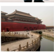
พระราชวังกู่กิง