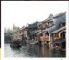
เมืองโบราณผานหลงกู่เจิน