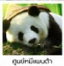
ดูแม่กบยักษ์แม่น้ำ

อุทยานหวงหลง / อุทยานจิวจ้ายโกว / ไร่ชาเขียว / สวนดอกไม้ / สวนผลไม้ / สวนสัตว์ / สวนน้ำ / สวนดอกไม้ / สวนผลไม้ / สวนสัตว์ / สวนน้ำ / สวนดอกไม้ / สวนผลไม้ / สวนสัตว์ / สวนน้ำ