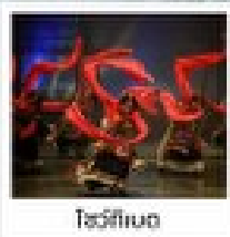
โรวี่ทิงตง