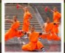
โชว์มโหรีพัน

PERIOD 1 : 9 - 14 สิงหาคม | PERIOD 2 : 18 - 23 ตุลาคม 2567