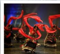
โชว์ทิเบต