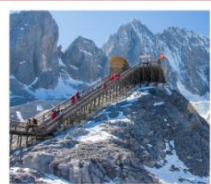
กุช่าหิมะมิงกรหยก

เมืองโบราณด้าหลี่ / เจดีย์สามองค์ / โถงแรกแม่ น้ำแยงซี / เมืองโบราณแซงกรี้ล่า วัดลามะชงจันหลิง / ซ่องแคบเสื้อกระโถด / เมืองโบราณซู๋เหอ / กุช่าหิมะมิงกรหยก หุบเขาพระจันทร์สีน้ำเงิน / โข่วจางอวี๋หมว / สระน้ำมิงกรต้า - เมืองโบราณลี่เจียง เขาสีซาน / ประตุมิงกร / วัดหยวนทง / สวนด้ากวนโหล