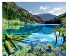
จิวจ้ายโกว