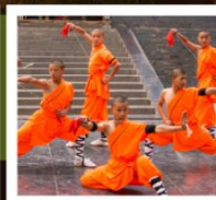
โชว์เส้าหลิน