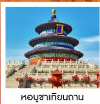
หอบูชาเทียนถาน