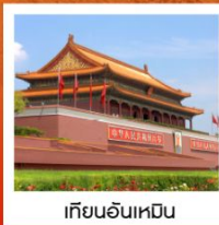
เทียนอันเหมิน