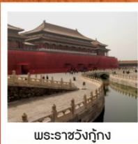
พระราชวังกู่กง