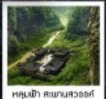
หลุมฟ้า ธรรมสวรรค์