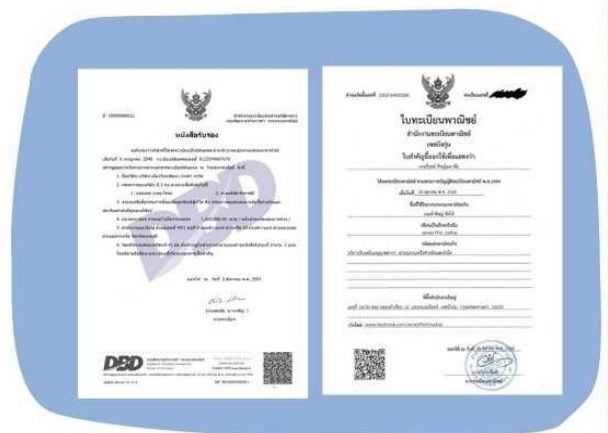
ตัวอย่างหนังสือจดทะเบียนบริษัทฯ และ ใบทะเบียนพาณิชย์