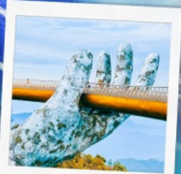
บาน่าฮิลล์