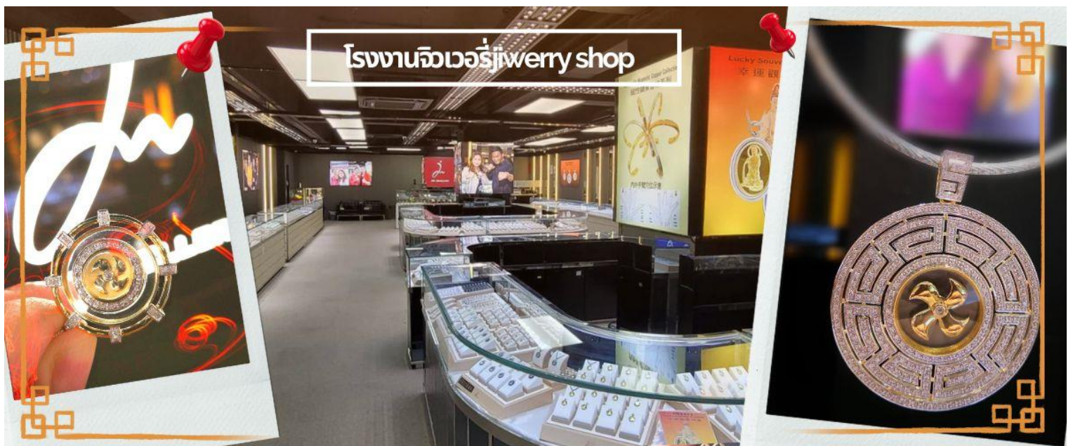
โรงงานจิวเวอรี่jewelry shop

จากนั้นนำท่านชม โรงงานจิวเวอรี่ ซึ่งเป็นโรงงานที่มีชื่อเสียงที่สุดของฮ่องกงในเรื่องการออกแบบเครื่องประดับ อาทิเช่น จี้ และแหวนกำหั้น ที่สวยงามโดดเด่นไม่เหมือนใคร ซึ่งถือกำเนิดขึ้นที่นี่และมีชื่อเสียงที่สุดใช้เป็นเครื่องประดับติดตัว และเสริมดวงชะตา สินค้าทุกชิ้นมีเอกสารรับประกันคุณภาพเปลี่ยน ซ่อม ได้ตลอดอายุการใช้งาน หากเกิดการชำรุดจากสินค้าไม่ใช่อุบัติเหตุ