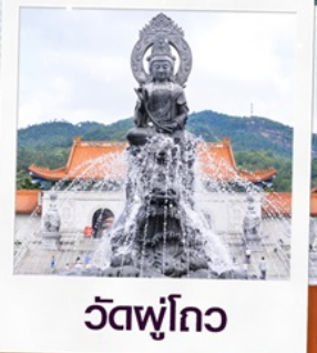
วัดฟูโกว