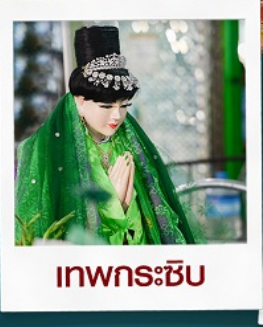
เทพกระซิบ