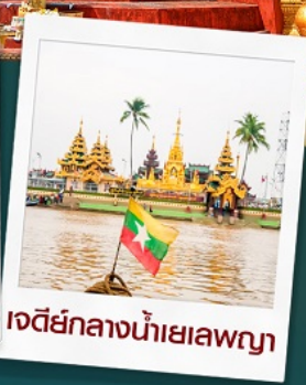
เจดีย์กลางน้ำเยเลพญา