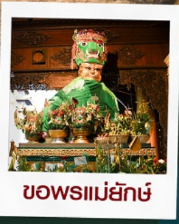
ขอพรแม่ย่า