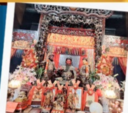
เทพเจ้ากวนอู วัดกวนไท่