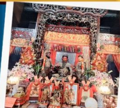
เทพเจ้ากวนอู วัดกวนไท่