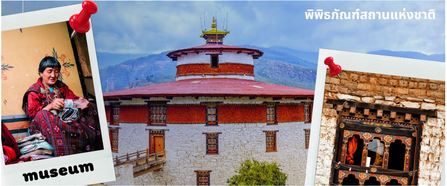
พิพิธภัณฑ์สถานแห่งชาติ

รับประทานอาหารเที่ยง ณ ภัตตาคาร (มื้อที่ 1)