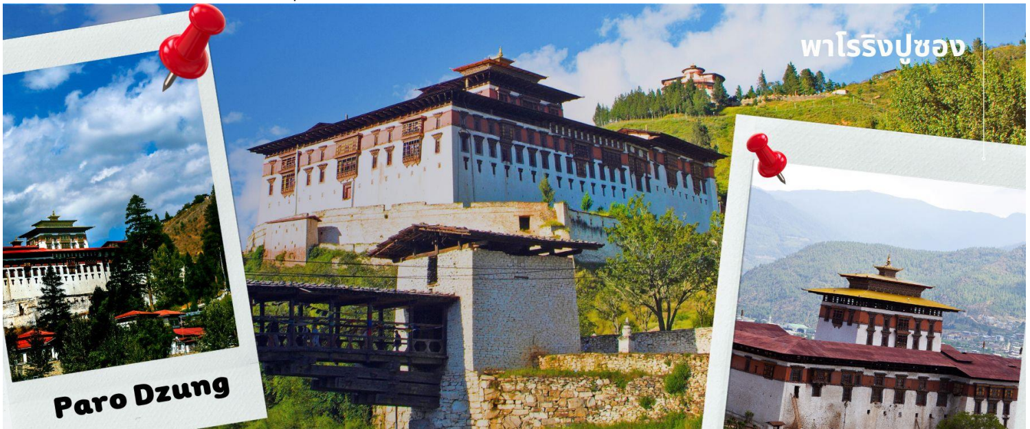
พาโรชิงปอซอง

นำท่านเดินทางไม่ไกล ชม พิพิธภัณฑ์สถานแห่งชาติ พิพิธภัณฑ์แห่งนี้เป็นที่เก็บรวบรวมหน้ากากศิลปะแบบพุทธมหายาน นิกายตันตระ ภาพพระบฏ อวูธ เทเรียญกษาปณ์ เครื่องมือเครื่องใช้ไม้สอยต่างๆ รวมถึงจัดแสดงความหลากหลายทางธรรมชาติอันสมบูรณ์ของประเทศเพื่อให้ทุกท่านได้รู้จักภูมิปัญญามากขึ้น ตรงข้ามกับอาคารพิพิธภัณฑ์ เป็นอาคารทรงกลมสีขาว เรียกว่า ตาซอง (Ta Dzong) หรือ หอคอย เดิมใช้เป็นหอสังเกตการณ์ข้าศึกศัตรูเนื่องจาก สร้างอยู่บนเนินสูง สามารถมองวิวตัวเมืองพาโรได้โดยรอบ