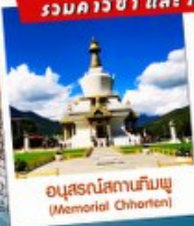
อนุสรณ์สถานทิมพู (Memorial Chorten)

2 คน พร้อมออกเดินทาง! รวมค่าวีซ่า และ ภาษีนักท่องเที่ยวแล้ว