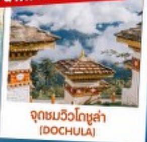
จุดชมวิวดอชูล่า (DOCHULA)