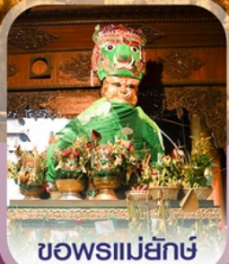
ขอพรแม่ยักษ์

✈️ คอนเฟิร์ม ออกเดินทาง ทุกพีเรียด 2 ท่านขึ้นไป