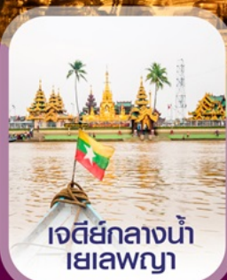
เจดีย์กลางน้ำ เยเลพญา

เข้คอิน ย่างกุ้ง สีเรียม พระมหาเจดีย์ชเวดากอง ไหว้พระ 5 วัด เสริมบุญ ต้อนรับศักราชใหม่