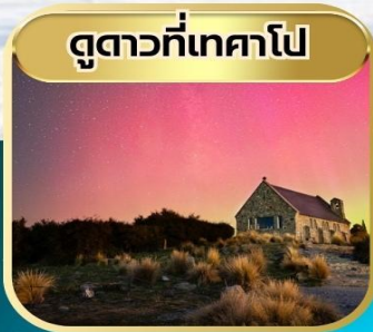
ดูดาวที่เทคาโป

จัดเต็ม!! รวมทีปคนขับรถ + ทีปหัวหน้าทัวร์ ราคาพร้อมวีซ่า / รวมทุกอย่างแล้ว