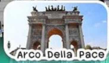
Arco Della Pace

เที่ยว มิลาน-เจนีวา-ปิซ่า-ฟลอเรนซ์- โบโลญญา-โคโม