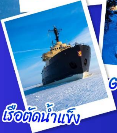
เรือตัดน้ำแข็ง