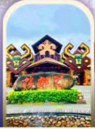
หมู้บ้านชนเผ่า