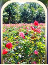
ทู้่อ่าย้าหลง