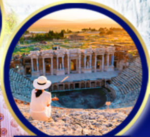
นครเอียราฟลิส