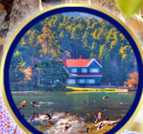
ทะเลสาบโกลจุก

อิสตันบูล • สุหรัสน้ำเงิน (บลูมอสก์) • สุหรัชนต์โซเฟีย • อีปโปโดรม • ตลาดสไปรท์ ม้าไม้จำลอง ซานิคคาเล่ • เมืองโบราณเอียราฟลิส • ปราสาทปูยฝ้าย • คาราวันขาราย พิพิธภัณฑน์มฟลานา • หุบเขานกพิราบ • ชมวิวเกอเรเน่ • นครใต้ดินซาดีค • หุบเขาอูชีซาร์ ทะเลสาบเกสิอ • พิพิธภัณฑน์อตาเดิร์ก • ทะเลสาบโกลจุก • หอคอยกาอาตา • จตุรัสทักซิม