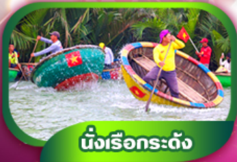
นั่งเรือกระดัง