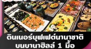
ดินเนอร์บุฟเฟต์นานาชาติ บนบานาฮิลล์ 1 มื้อ