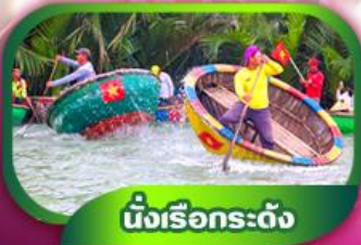
นั่งเรือกระดง