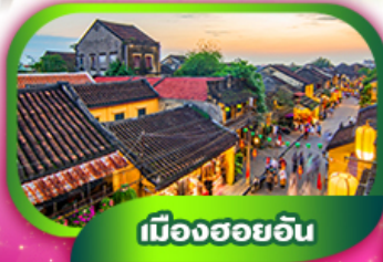
เมืองฮอยอัน