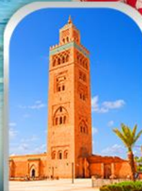
JEMAA EL-FNAA MARRAKESH