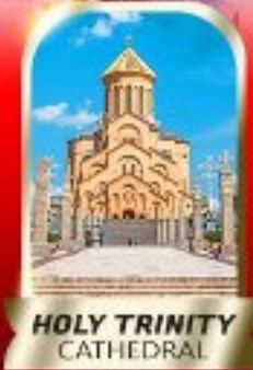
HOLY TRINITY CATHEDRAL