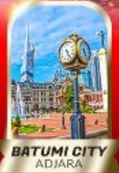
BATUMI CITY ADJARA

เมืองถ้ำอูพลิสซิค ■ ป้อมอนาบูชิ ■ นั่งกระเช้าชมเมืองบอร์โจมี อนุสาวรีย์มิตรภาพ รัสเซีย-จอร์เจีย ■ โบลด์เทอร์เก็ต วิหารจาวารี ■ มหาวิหารสเวทิตสเควซี