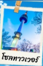
โซลทาวเวอร์