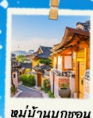
หมู่บ้านนุกซอน