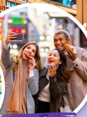
ตลาดเมียงดง