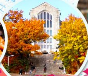
มหาวิทยาลัยฮ็ฮวา