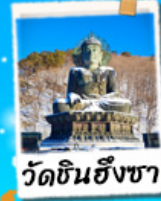
วัดชินฮังซา