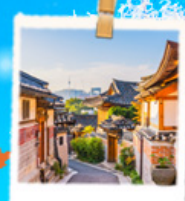
มุกชอนฮันอก