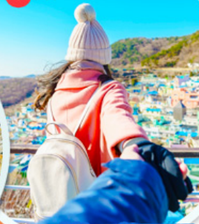
หมู่บ้านคัมซอน