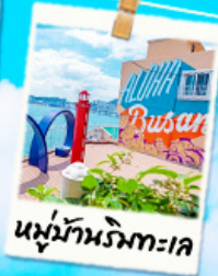
หมู่บ้านริมทะเล