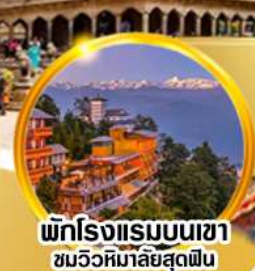
พักโรงแรมบนเขา ชมวิวหิมาลัยสุดฟิน