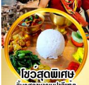
ไขว้สุดพิเศษ ลิ้มรสอาหารเนปาลแท้ๆ

ดินแดนศักดิ์สิทธิ์กลางห้อมกอดหิมาลัย สัมผัสสถาปัตยกรรมอันวิจิตรงดงาม กาฐมัณฑุ โทดรา ภัคตาปัวร์ ปาหั้น นากากีอิต